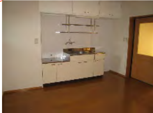
間取りは現況を優先します。