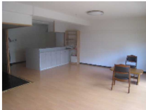
間取図は現況を優先します。